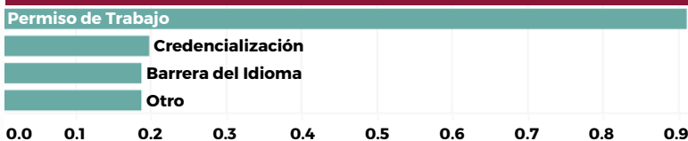
Figura 1. Desafíos principales del empleo (proporción de inscripciones)

Los obstáculos para el empleo primario eran la falta de autorización de trabajo o de permiso de trabajo. Los encuestados también notaron la incapacidad de transferir habilidades y credenciales de su país de origen, y la falta de conocimiento del idioma inglés.